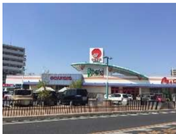
■山陽マルナカ 倉敷駅前店／ 1400m,約18分