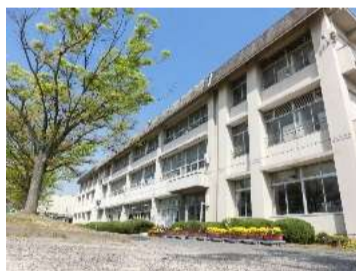
■万寿東小学校／ 350m,約4分