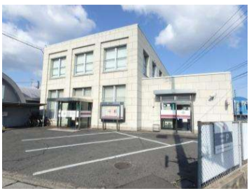
■中国銀行 倉敷北支店／ 1500m,約19分