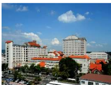
■倉敷中央病院／ 1200m,約15分